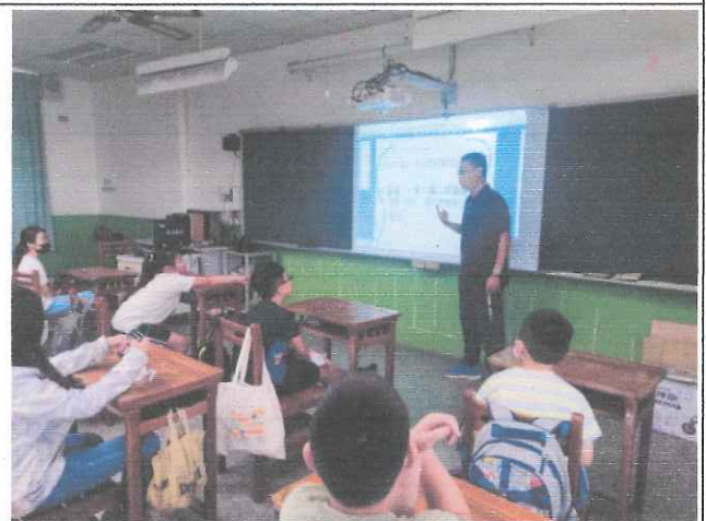
說明：老師法律知識宣導