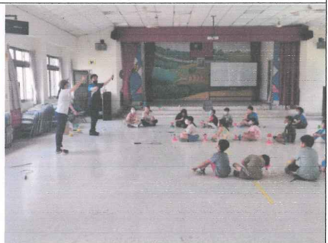
說明：教練示範並說明扯鈴技巧