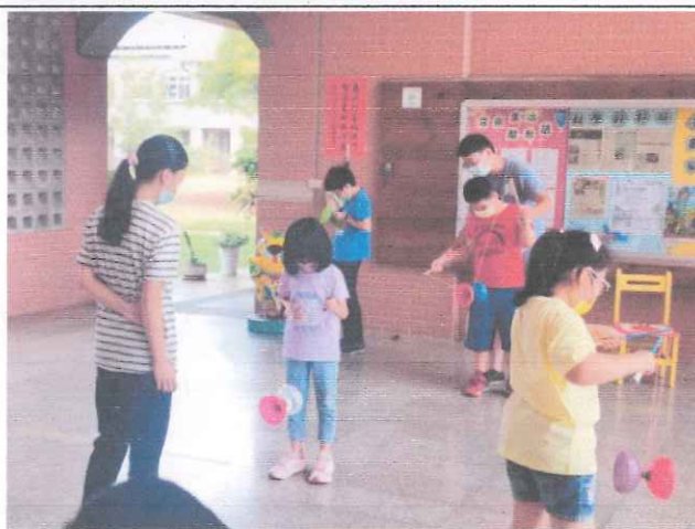
說明：教練個別指導學生扯鈴技巧